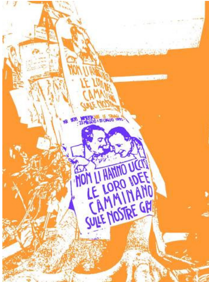
L'albero di Falcone in via Notarbartolo a Palermo